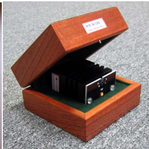
Рисунок 3. Образцовый источник излучения и светоголовка (справа).