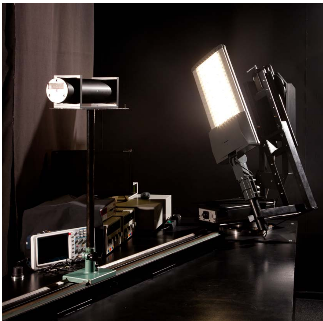
Рисунок 2. Внешний вид установки «Флак-20», эксплуатирующейся в лаборатории «АРХИЛАЙТ» Госреестр СИ №39536-08 и №39535-08.